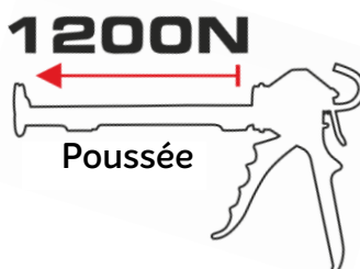
Levier en acier